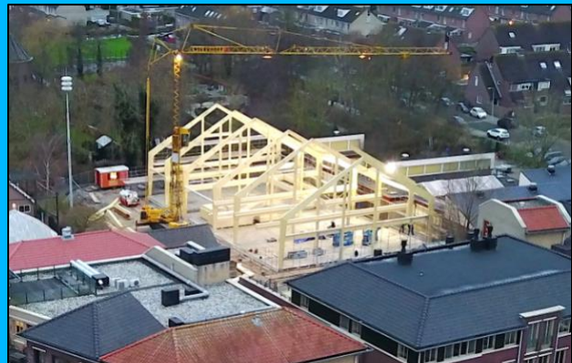
Bron impressies: WillemsenU